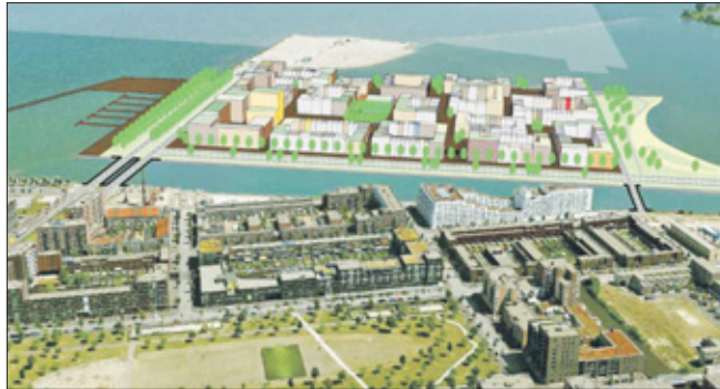
Een tekening van de nieuwbouwwijk op Centruimeiland, IJburg in Amsterdam.