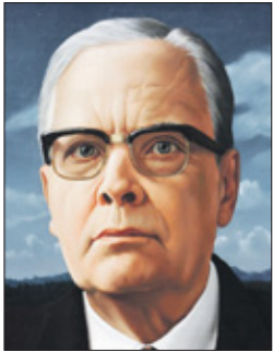
Portret van Cola Debot door Carel Willink.

Het college van burgemeester en wethouders (B&W) heeft de definitieve straatnamen vastgesteld voor 27 straten in een nieuwbouwwijk op Centruimeiland, IJburg in Amsterdam. Deze straten worden vernoemd naar mensen die zich hebben verzet tegen kolonialisme en slavernij in Indonesië, op de voormalige Nederlandse Antillen en in Suriname.