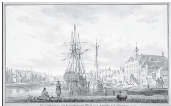
Een Verenigde Oostindische Compagnie (VOC)-werf en 's Landswerf aan het Boerengat in Rotterdam rond 1790.