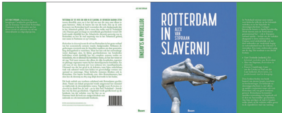
De omslag van het tweede deel.