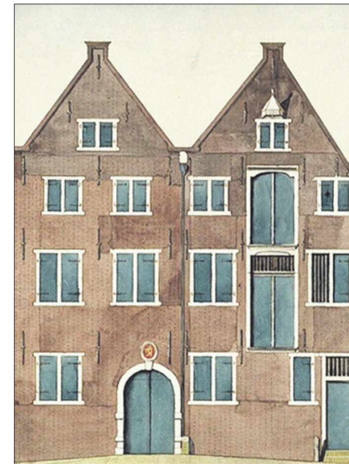
West-Indische pakhuizen Rotterdam, Nieuwehavenzijde.