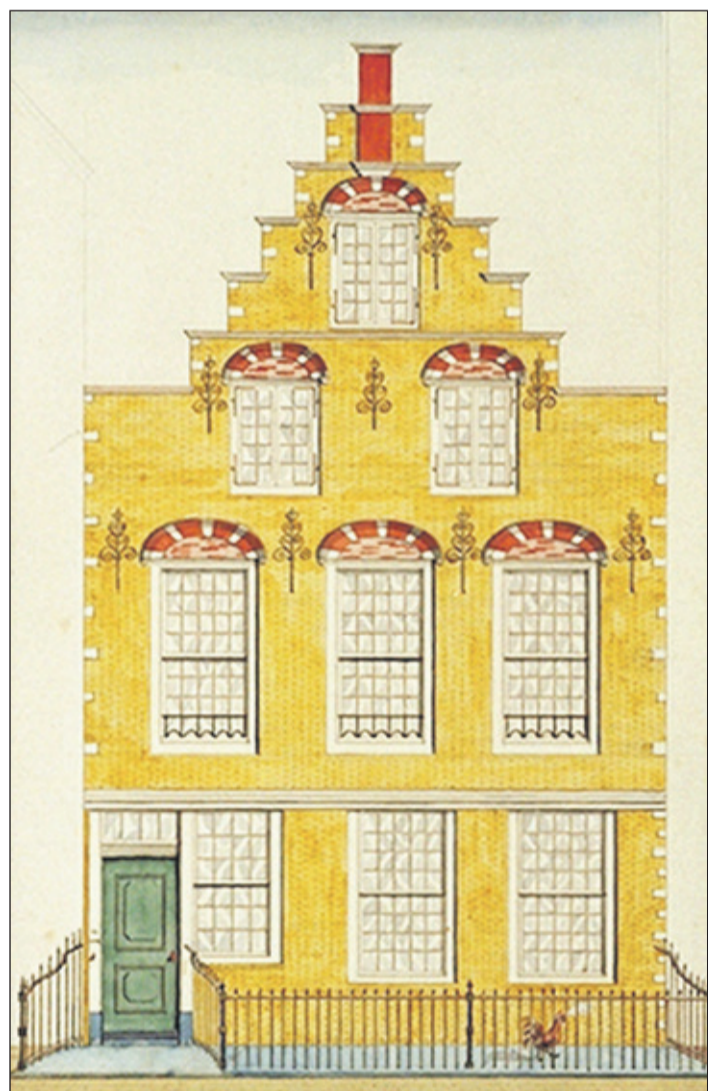
West-Indisch Huis Rotterdam.