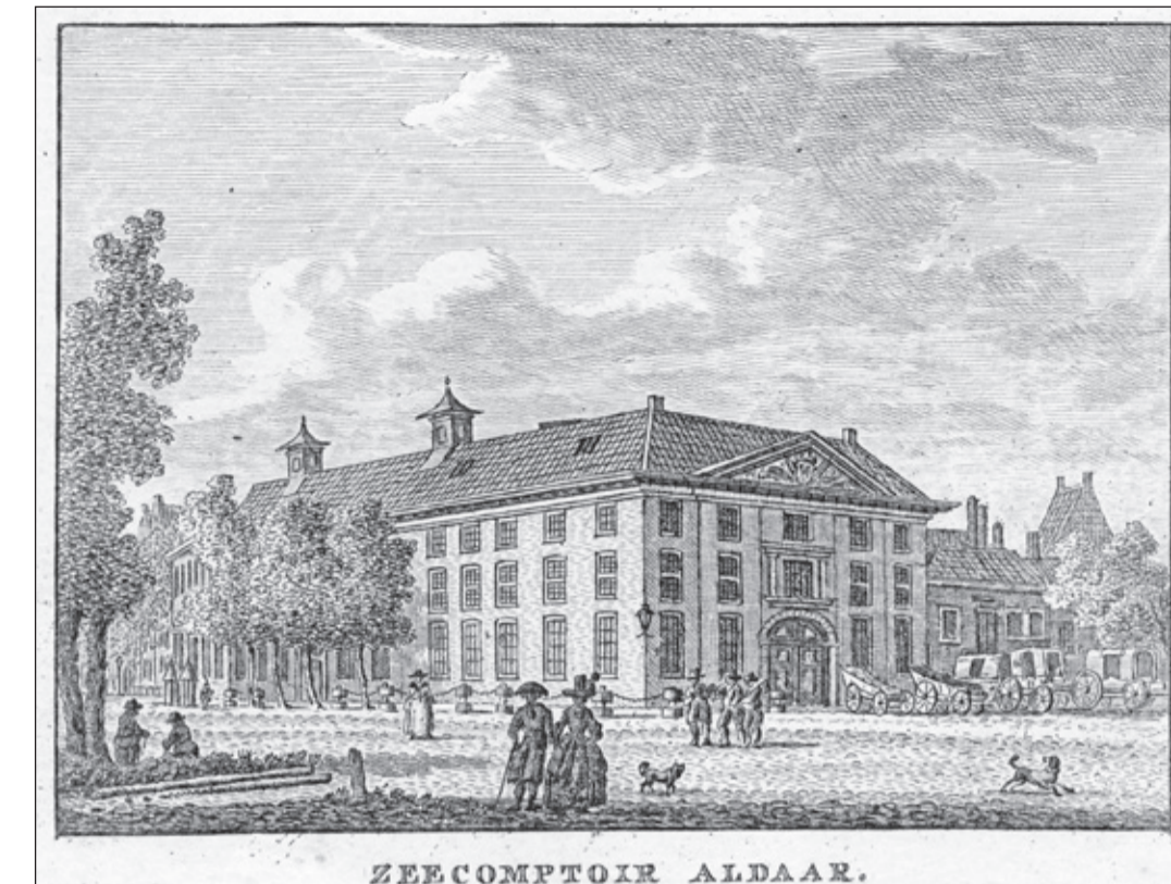
Het in 1662 in Rotterdam gebouwde Admiraliteitsgebouw voor de opslag van te verhandelen (exotische) goederen. De Admiraliteit voerde van 1588 tot 1799 het bewind over de zeezaken van de Republiek.